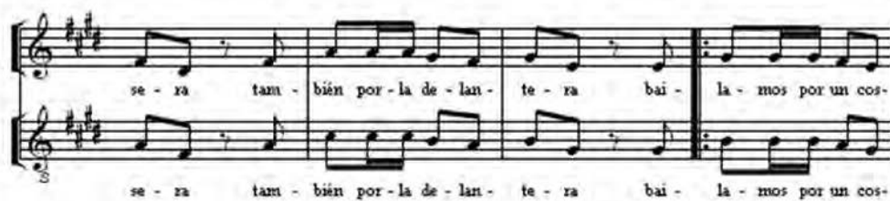
Imagen: 50 danzas Tradicionales y populares en Chile de Margot Loyola y Osvaldo Cádiz, Ediciones Universitarias de Valparaíso. Pontificia Universidad Católica De Valparaíso

Videos y audios en www.margotloyolaenelaula.cl